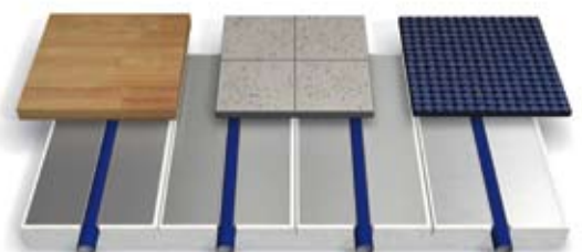
Fußbodenheizung im Trockenbau

Ob Neubau oder Sanierung, niemand sucht sich den Bodenbelag nach seiner Fußbodenheizung aus. JUPITER schenkt die volle Gestaltungsfreiheit: Fliese, Naturstein, Teppich, Parkett, Vollholzdielen, Kunststoffe oder Laminat – diese Fußbodenheizung lässt alle Bodenbeläge zu!