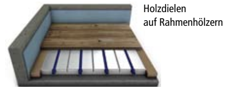
Holzdielen auf Rahmenhölzern