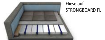
Fliese auf STRONGBOARD FL

Die (fast) direkte Fliesenverlegung ermöglicht die Lastverteillplatte STRONGBOARD FL . Auf diese werden die Fliesen im Floating-Verfahren verlegt. Estrichziegel® wirken zugleich als Lastverteilschicht und ergeben dank der glasierten Oberfläche einen ästhetischen Natursteinbelag.